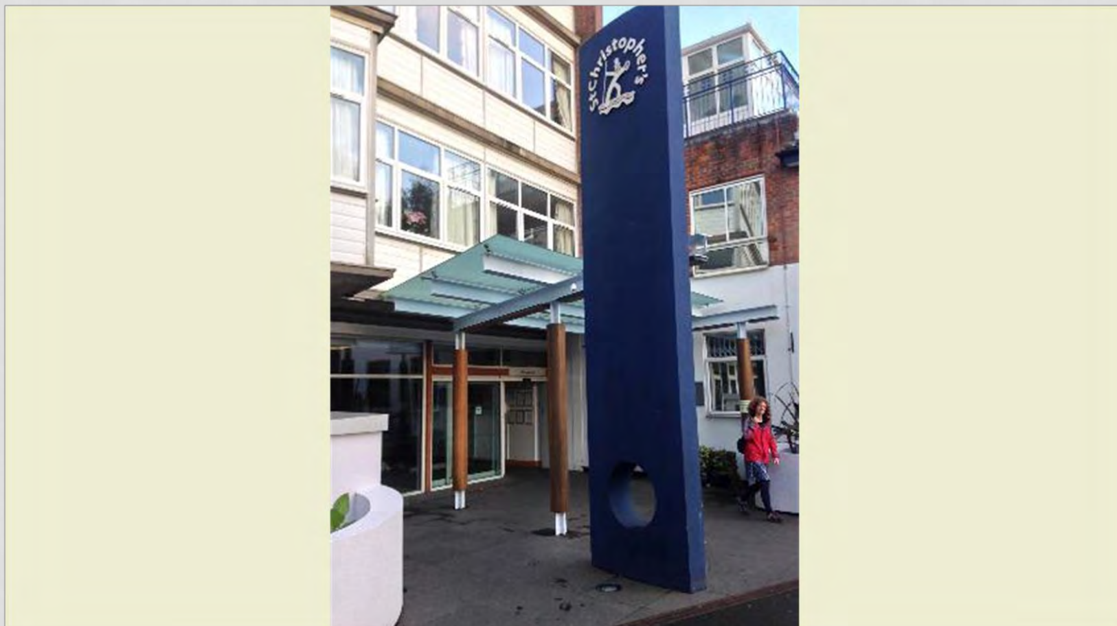
ST. CHRISTOPHER'S HOSPICE, SYDENHAM, LONDON