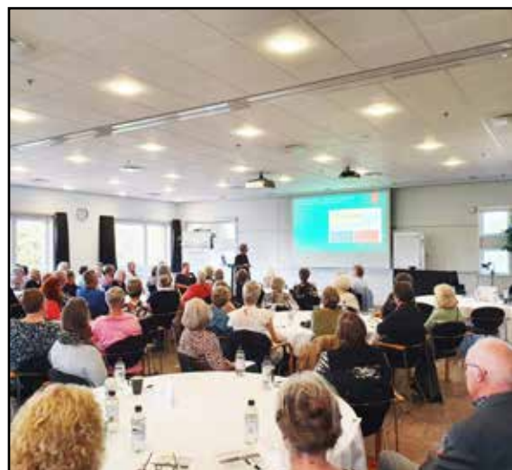
Spændende oplæg på frivilligseminaret

Nye og friske kræfter har heldigvis budt sig til for at deltage i udvalgets arbejde.