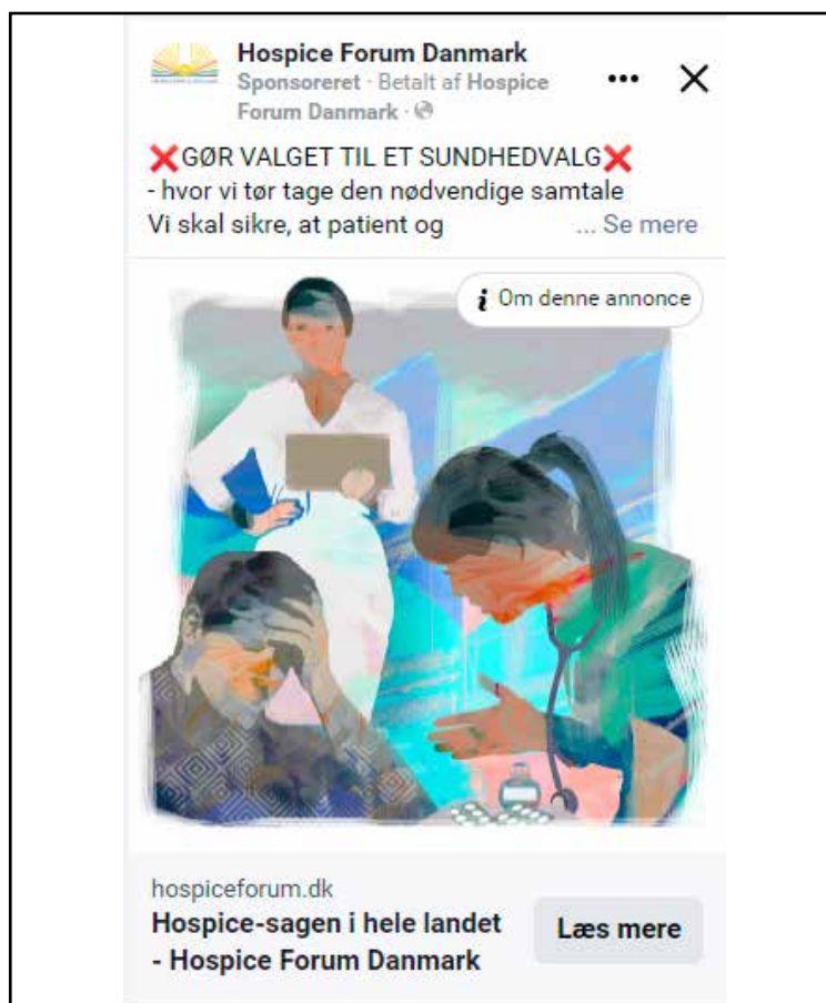
Annonce fra Facebook i forbindelse med Folketingsvalget 2022

Også i år har vi arbejdet med annoncer som formidlingsform. Vi fik gode tilbagemeldinger på den store 4-siders annonce i Kristeligt Dagblad, da vi første gang forsøgte os med det format. Derfor var vi i år med på samme vis. En så stor annonce giver nogle unikke mu-