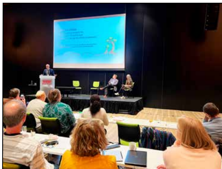
Oplæg på konferencen i Lillestrøm

Seminar for støtteforeningsbestyrelser holder vi efter målsætningen hvert andet år. I år var kun halvdelen af vores støtteforeninger repræsenteret. Vi har derfor