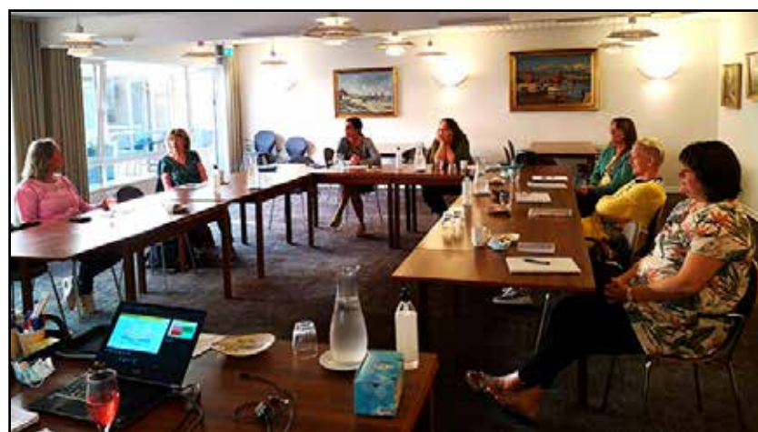
Heldigvis blev det muligt at samle nogle af koordinato- rerne til kursus

"Det var SÅ godt at mødes. Vi fik luftet så mange frustrationer, og det var bare helt generelt godt at sidde overfor hinanden og tale om, hvordan det havde været med må- nedsvi af hel eller delvis udeluk- kelse af de frivillige" lyder det fra en af koordinato- rerne