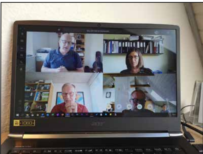
Et kig ind i et af bestyrelsens online møder

Om ikke andet fik vi i 2020 øvet os i at holde digitale møder. Vi havde i FU øvet os inden, da vores geografi gjorde det attraktivt. Vi har sparet megen tid på landevejene og begrænset rejseudgifterne. Når man kender hinanden godt, så kan det gå. Men nogle møder og specielle emner kræver nærhed og et rum, som ikke kan skabes virtuelt. Derfor er der emner, vi er nødsaget til at skyde foran os.